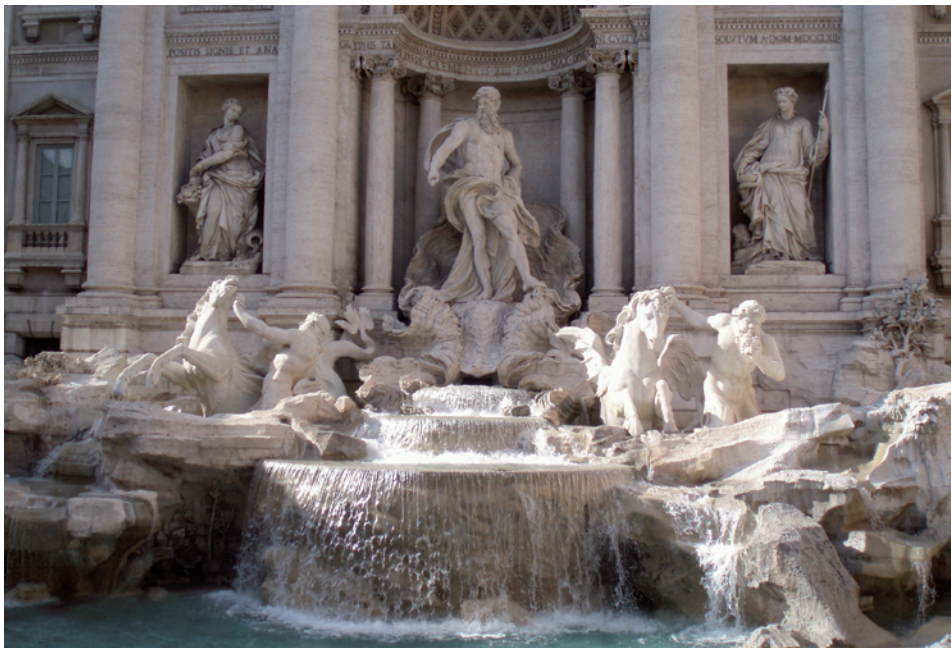
Trevifontein in Rome (Barok)

universum. Bij kerken gaat het om het uitbeelden van God's perfectie. Bij het ontwerpen gebruiken de architecten objectieve proporties. Alle verhoudingen, zowel van onderdelen onderling als onderdelen tot het geheel, moeten uitgedrukt kunnen worden in gehele getallen. Dit ontstond onder andere onder de invloed van de stelling van Pythagoras. Als het ideale kerkgebouw beschouwt men de centraalbouw, waarvan de plattegrond is gebaseerd op de cirkel. Bij centraalbouw wordt het gebouw rond een middelpunt ontworpen en de lengte en breedte is ongeveer even lang genomen. De cirkel is zowel in de oudheid als in de Renaissance zeer belangrijk en leidt tot speculaties over een godsbegrip. Centraalbouw vormt ook de plattegrond van diverse Romeinse ruïnes die ten tijde van de Renaissance, meestal ten onrechte, als tempel worden beschouwd. In de vroege Renaissance worden nog Romeinse kenmerken gekopieerd, de Griekse bouwkunst was toen nog niet bekend bij de Italianen. In de Hoog Renaissance wordt er niet meer gekopieerd, maar nog wel gebouwd volgens de klassieke ideeën. Een voorbeeld hiervan is Tempio del Bramante. In de zestiende eeuw ontwikkelt de Renaissance zich stijl tot het maniërisme. Het doel om harmonie te bereiken ontwikkelt in het doel om zo grandioos en indrukwekkend mogelijke gebouwen te ontwerpen. Kenmerken van Maniëristische architectuur zijn contrastrijke oppervlakstruc-