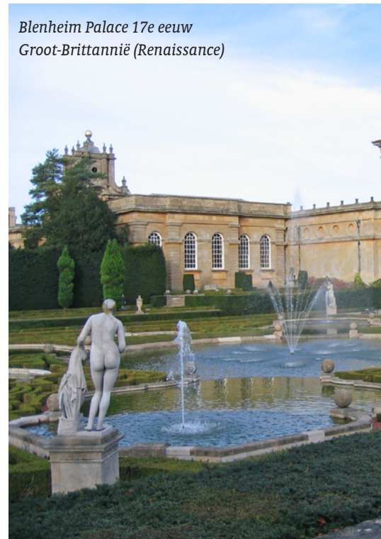
Blenheim Palace 17e eeuw Groot-Brittannië (Renaissance)

In de architectuur in Italië ontstaat er een nieuw begrip van schoonheid. Schoonheid is het uitbeelden van de harmonie van het