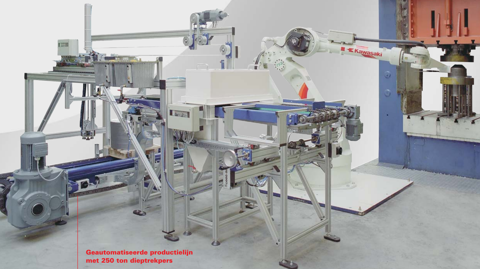
Geautomatiseerde productielijn met 250 ton dieptrekkers