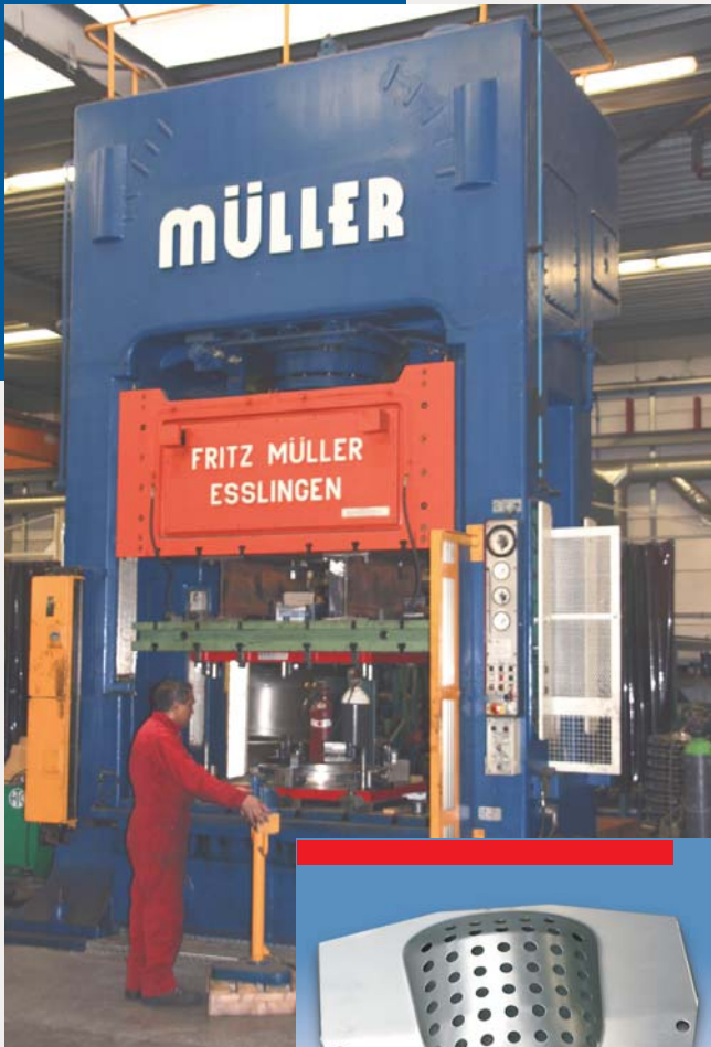
Dieptrekpers 400 ton