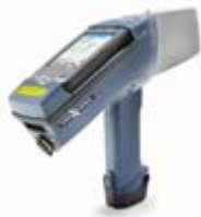
figuur 4-1: voorbeeld handheld XRF zoals gebruikt tijdens de controles

Voor het meten van zware metalen in elektr(on)ische apparatuur is speciale apparatuur nodig. Voor dit project is gebruik gemaakt van een handheld XRF-analyser.